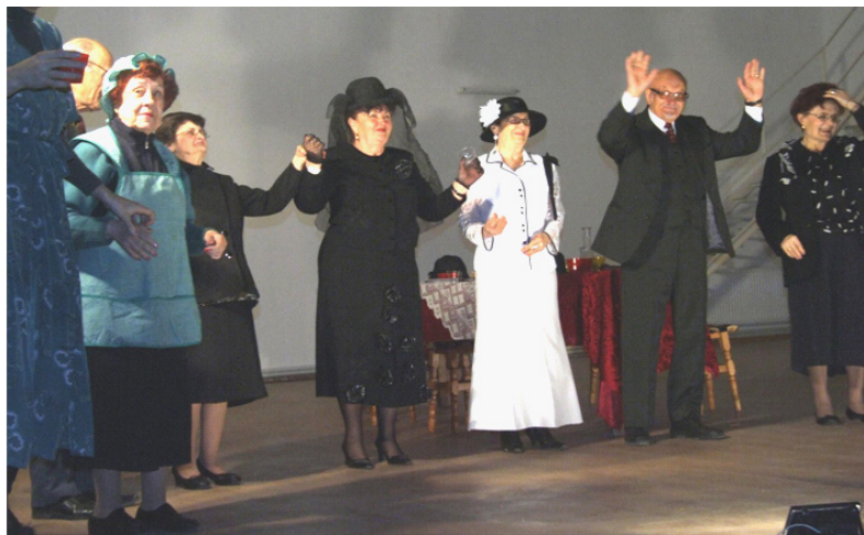
Trupa "Ambițioșii" a Bibliotecii Județene "Panait Istrati" Brăila

Inițiative frumoase s-au înregistrat și la Biblioteca Județeană Panait Istrati Brăila, unde persoanele de vârstă a treia au creat trupa Ambițioșii , sub coordonarea unui bibliotecar și au oferit spectacole în multe alte biblioteci din țară, dobândind o anumită notorietate, realizând schimburi de experiență sau motivând și pe alții să implementeze un astfel de serviciu pe cât de util, pe atât de plăcut. La ora actuală, această trupă este un model de inspirație și pentru alte biblioteci cum ar fi cea de la Tulcea.