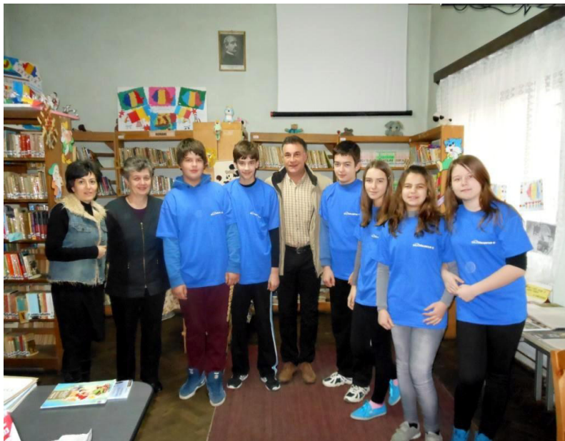
Bibliovoluntarii de la Șimleul Silvaniei

Intuind potențialul bibliotecilor, Asociația Există viață după dolieu derulează o serie de activități de suport prin intermediul bibliotecilor din Cluj, București, Prahova sau Neamț ceea ce demonstrează arată interesul pe care îl trezește acest subiect în rândul oamenilor.