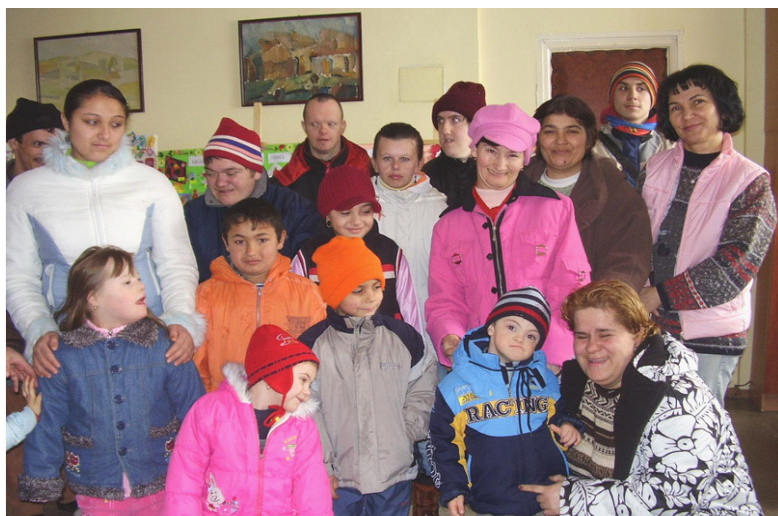
Grupul suport de la Biblioteca Municipală "Lucian Blaga" Sebeș, județul Alba

Bibliotecile românești, din păcate, nu oferă în acest moment prea multe posibilități pentru această categorie de persoane. Biblioteca Municipală Lucian Blaga Sebeș a dezvoltat un parteneriat cu Asociația Trebuie în vederea constituirii unui grup-suport dedicat persoanelor cu dizabilități psiho-motorii (foto), iar Biblioteca Județeană Astra Sibiu are un atelier de biblioterapie Eu sunt eu! pentru copii cu autism și handicap neuropsihomotor și familiile acestora.