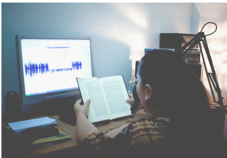
Biblioteca sonoră pentru nevăzători și ambliopi din cadrul Bibliotecii Metropolitane București

Un serviciu pentru persoane cu deficiențe de vedere, însă realizat extern, adică în afara zidurilor bibliotecii, se întâmplă la Biblioteca Județeană Károni János Harghita, unde bibliotecarul se deplasează la sediul clubului nevăzătorilor din localitate, împrumutând documente, dar colaborând și la activitățile organizate de aceștia.