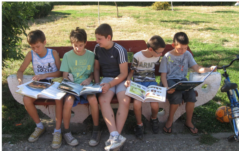
Lectură în parc la Biblioetca Județeană Duiliu Zamfirescu Vrancea

Tot în Vrancea, la Biblioteca Județeană Duiliu Zamfirescu , s-a desfășurat proiectul Biblioteca de vacanță , pe perioada vacanței mari, când actori ai Teatrului Municipal Focșani, părinți, bunici, bibliotecari, copii, au citit pentru public pe teme date sau alese de cititori, în parc, în spațiul rezervat bibliotecii.