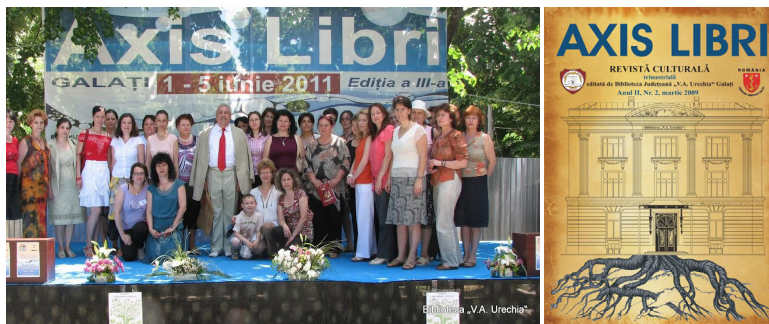
Axis Libri - o marcă promovată de Biblioteca Județeană "V.A. Urechia" Galați

Biblioteca Județeană V.A. Urechia Galați, de asemenea, are o experiență bogată în organizarea de evenimente de mare amploare, care sunt deja grupate sub marca Axis Libri și mai multe componente: revistă de cultură, festival național de carte și salon literar.