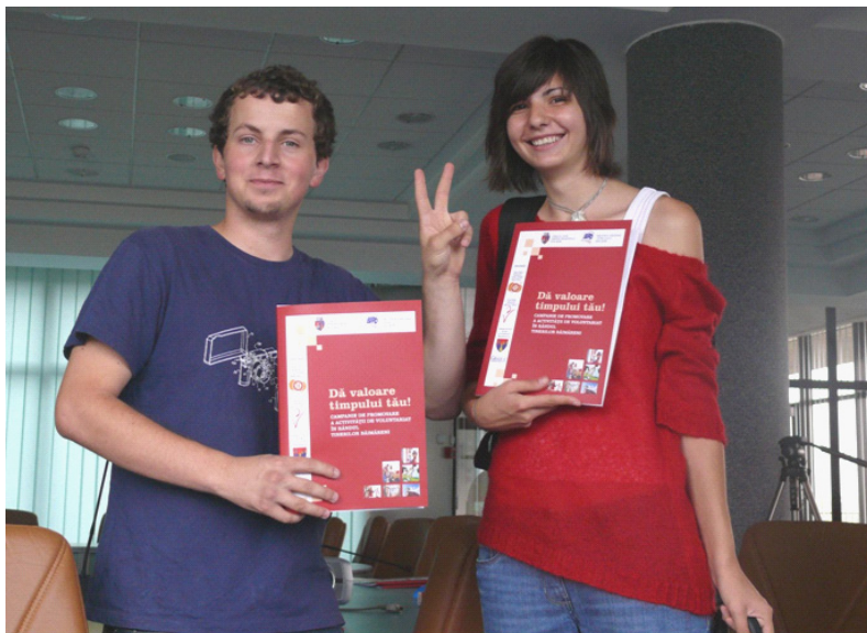
Voluntari implicați în proiectul “Dă valoare timpului tău” - Biblioteca Județeană “Petre Dulfu” Baia Mare

La Suceava, proiectul Ajutor la teme pentru copiii instituționalizați din Centrele de plasament Speranța și Colț Alb , presupune acordarea unor meditații săptămânale, asigurate de profesori din unitățile școlare din municipiul Suceava, profesori pensionari, studenți și bibliotecare cu pregătire adecvată, urmărindu-se îmbunătățirea situației școlare a acestor copii, reducerea diferențelor de șanse față de colegii lor, ridicarea gradului de încredere în forțele proprii și stimularea potențialului intelectual. Un proiect similar de tip after school există și la Biblioteca Județeană I.S. Bădescu Sălaj.