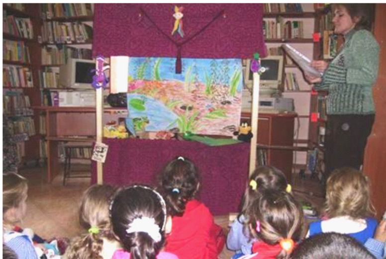
Lectură animată la Biblioteca Municipală din Câmpia Turzii

În Harghita, din februarie 2009 se desfășoară programul amplu numit Maratonul poveștilor (Mesemaron), inițiat de Centrul Cultural Județean Harghita. Alături de Biblioteca Județeană Kájoni János Harghita participă mai multe biblioteci publice din județ precum și școli, asociații și instituții din diverse localități. Începând cu anul 2011 participarea la program s-a extins la nivel internațional. Se pun la dispoziția celor care citesc, cărți din colecțiile bibliotecilor sau ale cititorilor, s-au folosit echipamente primite prin proiectul Biblionet pentru proiecții și audiere de versuri pe muzică, în acest mod fiind evidențiate și alte servicii ale bibliotecii, în afară de împrumutul tradițional de carte. Pentru longevitatea și răspândirea lui, acest proiect poate fi considerat un bun exemplu pentru cei care doresc să acumuleze mai multă experiență în ceea ce privește implementarea unui astfel de serviciu.