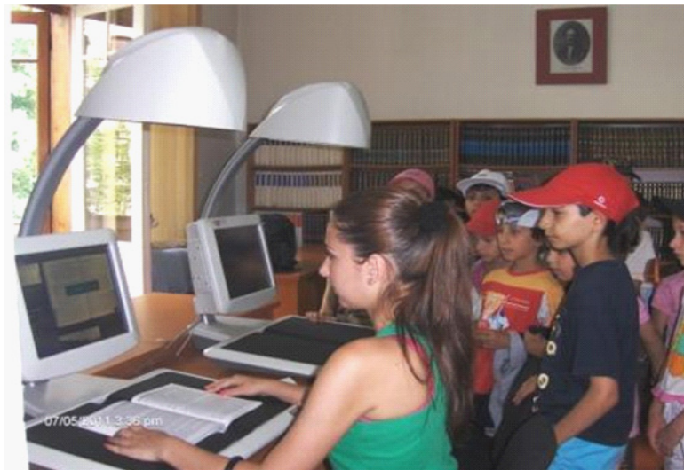
Vizită ghidată la Biblioteca Metropolitană București

anul 2012, a realizat aproximativ 185 de astfel de tururi de prezentare. La Biblioteca Județeană Lucian Blaga Alba aceste vizite sunt cunoscute sub numele de ABC-ul bibliotecii , iar Biblioteca Metropolitană București și-a denumit, din 2003, acest tip de serviciu Biblioteca de la A la Z , devenind o activitate continuă, intrată în practica curentă a bibliotecii.