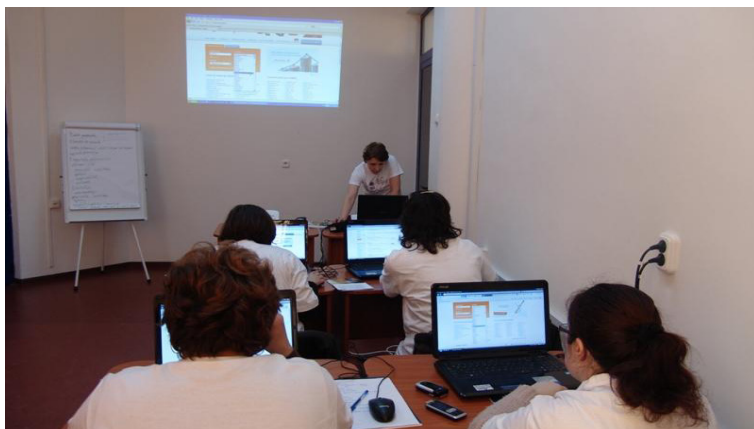
Instruirea publicului pentru a-și găsi mai ușor un loc de muncă - Biblioteca Județeană "Octavian Goga" Cluj

- cum se completează un CV, o scrisoare de intenție (Biblioteca Orășenească Aleșd, județul Bihor). Pe aceeași tematică Biblioteca Județeană Octavian Goga Cluj a dezvoltat în 2011 un proiect de succes Cum să găsești o carte de... muncă?