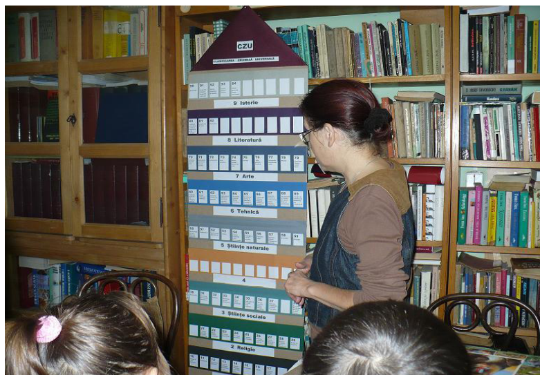
Materiale create de bibliotecara de la Biblioteca Comunală Săcuieni, județul Bihor

Biblioteca Comunală Săcuieni, județul Bihor, a realizat și ea câteva materiale inedite care îndrumă în folosirea bibliotecii.